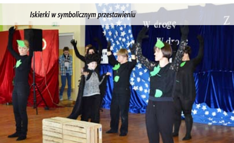
Iskierki w symbolicznym przedstawieniu