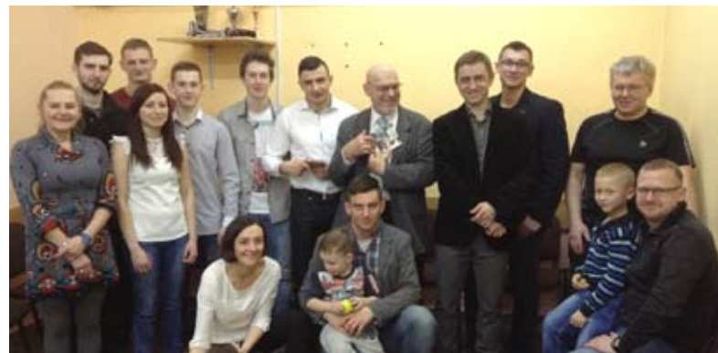
Spotkanie po latach. Niektórzy zawodnicy przejechali kawał drogi, aby spotkać się ze swoim dawnym trenerem