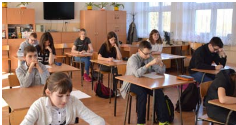
Władze miasta i międzyrzeckich placówek oświatowych stawiają na wszechstronny rozwój dzieci

w ramach Europejskiego Funduszu Społecznego, które umożliwiają realizację dodatkowych zajęć i wyposażanie pracowni. Wszystkie międzyrzeckie szkoły przystąpiły do Narodowego Programu Rozwoju Czytelnictwa, dzięki któremu możemy pozyskać pieniądze na zakup ciekawych pozycji książkowych. W budżetach szkół zaplanowano środki finansowe na zakup pomocy dydaktycznych, doskonalenie zawodowe nauczycieli oraz na zastępstwa za nieobecnych nauczycieli.