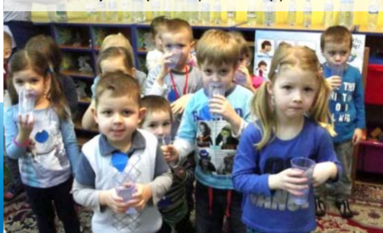
Przedszkolaki z „dwójki” wiedzą, co robić by mieć zdrowe zęby

Samorządowe Przedszkole nr 2 wzięło udział w ogólnopolskim programie „Dzieciństwo bez próchnicy”, który polega na edukacji i profilaktyce w kierunku zdrowia jamy ustnej. Kampania skierowana jest nie tylko do maluchów, ale ich rodziców i opiekunów. Wzięli oni udział w spotkaniu i prelekcji multimedialnej, podczas której przybliżony im został problem próchnicy u małych dzieci. W każdej grupie odbyły się spotkania ze stomatologiem, który wytłumaczył przedszkolakom, czym jest próchnica i jak można jej zapobiec. Każde dziecko otrzymało broszurkę z ilustracjami oraz pastę i szczotkę w etui. Przedszkole uczestniczy także w programie edukacyjnym „Mamo, tato wolę wodę”. Jego celem jest podkreślenie roli wody w codziennej diecie oraz wspieranie rodziców w kształtowaniu prawidłowych nawyków żywieniowych u dzieci.