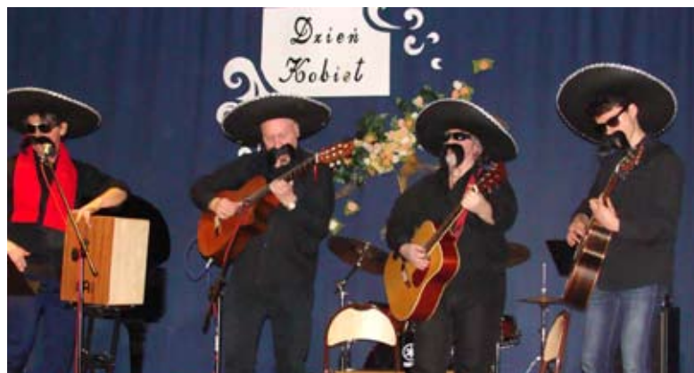
Meksykańskie klimaty rozruszały publiczność

Koncerty w Szkole Muzycznej cieszą się ogromnym powodzeniem. 10 marca uczniowie i nauczyciele przygotowali niespodziankę z okazji Dnia Kobiet. Tym razem występowali tylko mężczyźni wykonując zróżnicowany repertuar: solowy i zespołowy, instrumentalny i wokально-instrumentalny. Przeważała muzyka rozrywkowa. Gromkimi brawami nagrodzono gości „prosto z Meksyku”, którzy wykonali piosenkę z filmu „Desperado”. Żadna z pań nie wyszła z pustymi rękami, każda otrzymała symboliczny kwiat.