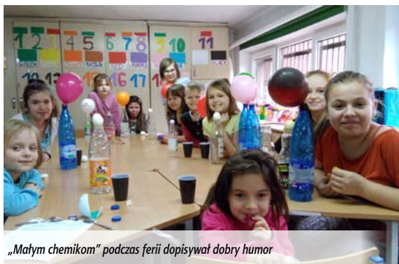
„Małym chemikom” podczas ferii dopisywał dobry humor

W czasie ferii zimowych Świetlica Środowiskowa „Strefa Serca” była bardzo aktywna. Tematem wiodącym zajęć były kontynenty świata. Dzieci poznawały je podczas zabawy, zajęć plastycznych i prezentacji multimedialnych, a także z tematycznych czytanek. Najwięcej entuzjazmu wywołały domowe eksperymenty. Przeprowadzane w bezpieczny i ciekawy sposób zachęciły wychowanków do pogłębiania wiedzy, a przede wszystkim stanowiły wspaniałą zabawę i pracę w grupie. Uczestnicy zajęć regularnie chodzili na basen, lodowisko oraz na spacer do parku.