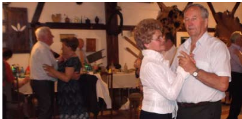
Członkowie Polskiego Związku Emerytów, Rencistów i Inwalidów mogli spędzić miło czas, wśród dobrej muzyki