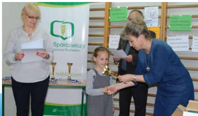
Uroczyste wręczenie nagród i wyróżnień