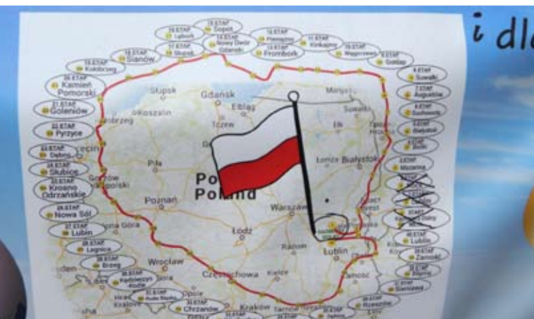
Mapka przedstawiająca trasę, którą zamierza pokonać Kazimierz Piskorek w 45 dni