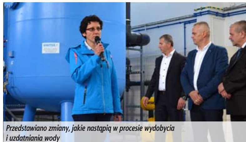
Przedstawiano zmiany, jakie nastąpią w procesie wydobycia i uzdatniania wody