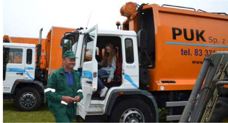
Dzieci i młodzież mogła wejść do pojazdów PUK i obejrzeć nowoczesne sprzęty

dernizowanych procesów wydobycia i uzdatniania wody. Na zakończenie każdy mógł poczęstować się grillowanymi kiełbaskami oraz słodkościami.