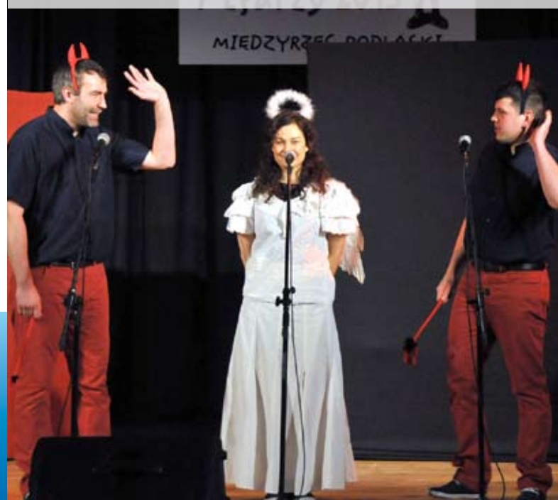
Kabaret „O TAK O” zajął III miejsce