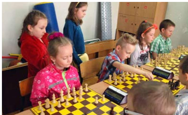
Atmosfera rywalizacji nie opuszczała turnieju