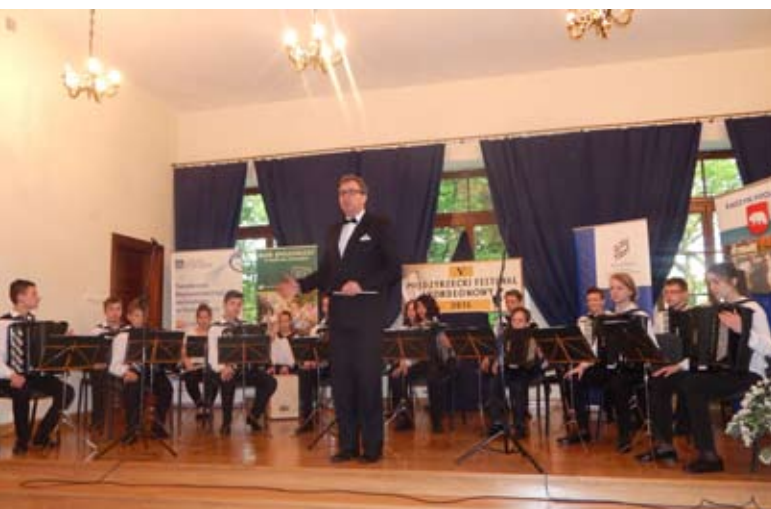
Orkiestra Akordeonowa Arti Sentemo z Radzyna Podlaskiego