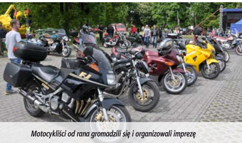
Motocykliści od rana gromadzili się i organizowali imprezę