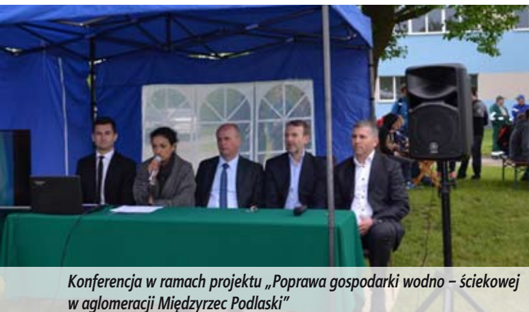
Konferencja w ramach projektu „Poprawa gospodarki wodno – ściekowej w aglomeracji Międzyrzec Podlaski”