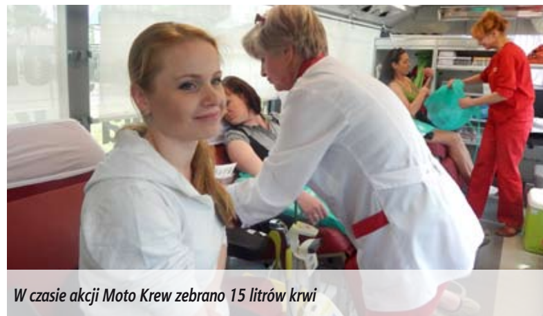
W czasie akcji Moto Krew zebrano 15 litrów krwi